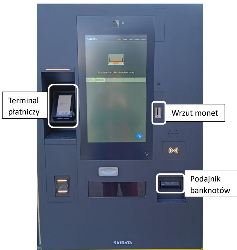
(fot. duża kasa)