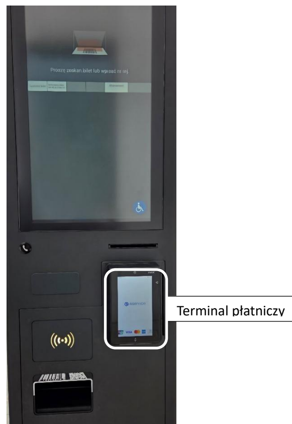
(fot. mała kasa – tylko opłaty karta)